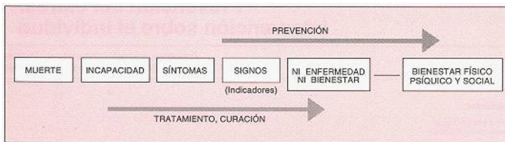
Cuadro 1: Esquema de un planteamiento preventivo del estrés

La detección de estos indicadores no es difícil, tanto por la gran cantidad de manifestaciones que origina el estrés como por las características de esta problemática; el estrés es un problema que se va desarrollando progresivamente de manera que se puede identificar en diversas fases de su desarrollo y, por lo tanto, existen diferentes grados de estrés (cuadro 1).